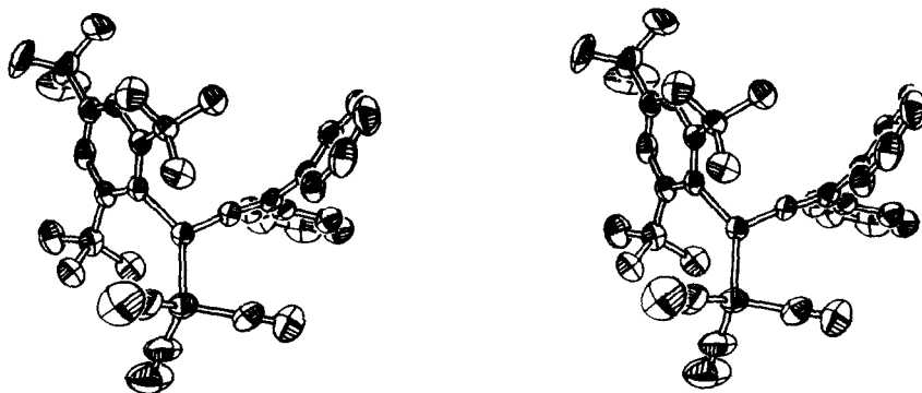
Fig. 1. Stereobild von III.

Einfluss auf die Geometrie des \eta^1 -koordinierten Phosphaallens in III. Die Umgebung des P-Atoms ist im Rahmen der Messgenauigkeit planar. Beim Auflösen